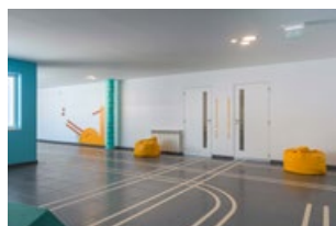
1ER ÉTAGE - Couloir de l'École Primaire - Cigogne

Les couloirs sont des extensions des salles de classes, incluant des espaces d'exposition et des zones d'exploration et de divertissement.