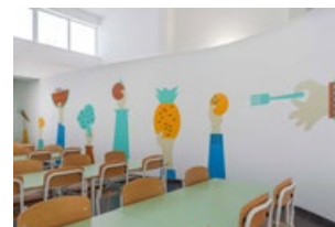
RDC - Cantine

Les chênes-lièges dans les couloirs ont été créés pour afficher les travaux scolaires et renforcer l'idée d'extérieur dans l'espace intérieur.