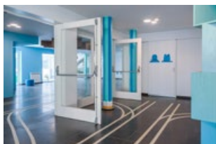
RDC - Entrée

A l'entrée du bâtiment, une représentation du chemin de fer invite à déambuler dans les différents espaces de l'école.