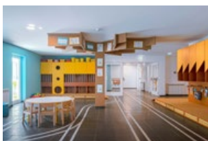
RDC - Couloir de l'École Maternelle

Dans la zone centrale du bâtiment, il y a une cour intérieure qui permet aux élèves d'avoir un espace d'apprentissage différent, cette fois à l'extérieur.