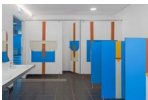
RDC - Toilettes

Il y a de petites zones dans les couloirs qui appellent à la concentration, des espaces d'exposition et des zones d'exploration comme la cabane dans les arbres.