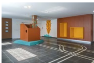
1ER ÉTAGE - Couloir de l'École Primaire - Cabane dans l'arbre

Des meubles sur mesure ont été conçus pour rendre les pièces amusantes. Chaque module représente un wagon de train et est identifié par un numéro qui distingue les multiples fonctions.