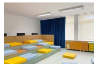
Plate-forme de sièges

Les salles de sport comprennent des illustrations qui suggèrent le sport, promouvant les exercices physiques.