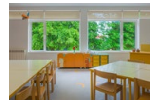
1ER ÉTAGE - Salle de classe

La bibliothèque possède 3 zones: ordinateurs, zone de lecture et zone d'étude. Ici, il est prévu que les élèves découvrent des connaissances par eux-mêmes.