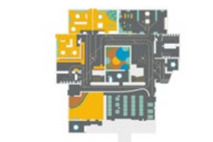
GIF - Carte des aménagements des salles de classe

Il y a un plan d'orientation à l'entrée de l'école pour comprendre les espaces et communiquer l'image graphique.