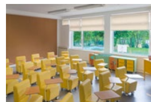
1ER ÉTAGE - Auditorium

En se promenant dans les différents espaces, nous pouvons trouver des objets inhabituels comme une cheminée et une cigogne.