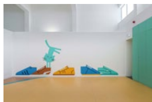
RDC - Salle de sport

Dans les toilettes, nous trouvons des valises qui renforcent le concept de voyage exploré dans l'identité de l'école.