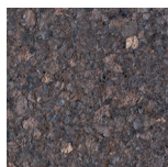
96A Corcho Oscuro

Acabado con una capa acuosa incolora con propiedades de repelencia al agua, aceite y manchas y alta resistencia a los rayos UV y al envejecimiento, manteniendo el tacto natural y la transpirabilidad del corcho.