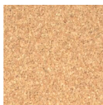
97A Corcho Claro