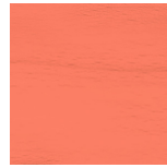
BSHV7 Fond Orange