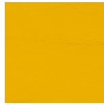
BSHV10 Dry Yellow