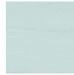
BSHV13 Baby Blue